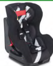
Автокресло группы I