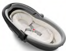
Автокресло «люлька» группы 0

Детские удерживающие устройства подразделяют на 5 весовых групп: