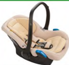
Автокресло группы 0+