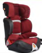
Автокресло группы III

для детей массой 22-36 кг (возможно использование бустера)