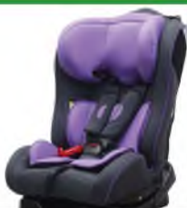
Автокресло группы II